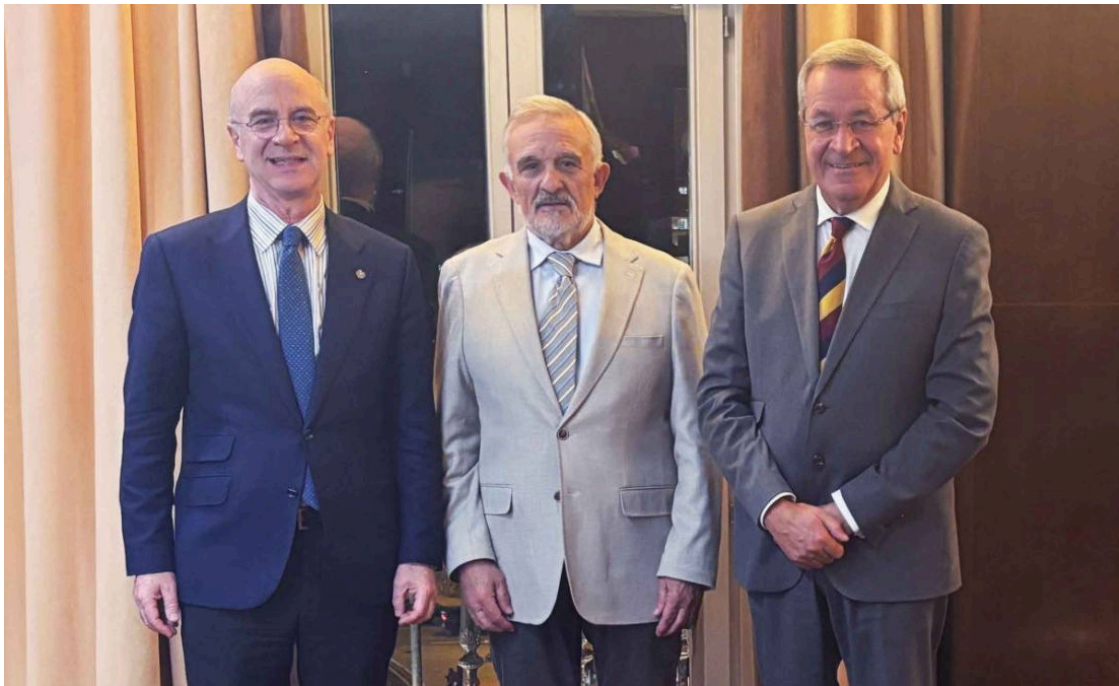
El Colegio de Médicos de Zamora y PSN colaborarán para ofrecer seguros y servicios preferentes a facultativos - PSN

El Colegio de Médicos de Zamora y Previsión Sanitaria Nacional (PSN) han firmado un acuerdo de colaboración que permitirá a los facultativos zamoranos acceder de manera preferente a la amplia cartera de soluciones aseguradoras de la mutua.