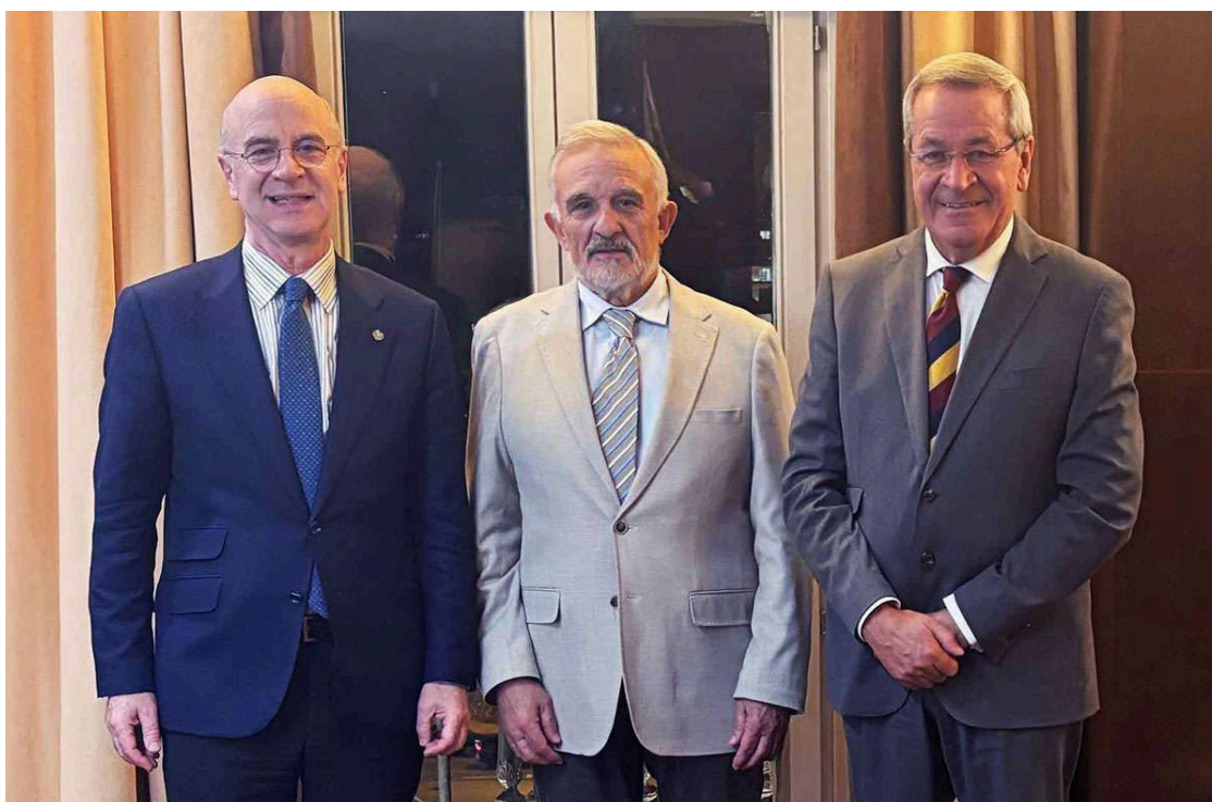
News/ Últimas Noticias

El Colegio de Médicos de Zamora y Previsión Sanitaria Nacional (PSN) han suscrito un colaboración por el que acuerdo de los facultativos zamoranos tendrán acceso preferente a la amplia cartera de soluciones aseguradoras que la mutua pone a su disposición.