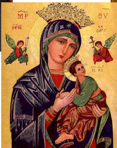
Nª Sª del Perpetuo Socorro