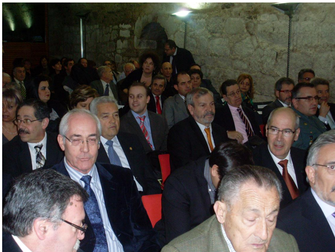
Miembros de la Junta Directiva del I. Colegio Oficial de Médicos de Zamora