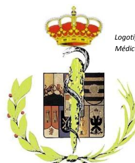
Logotipo Colegio de Médicos de Zamora